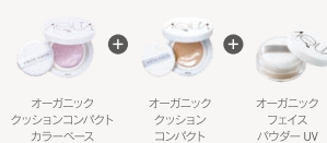
オーガニック クッションコンパ クトカラーベース